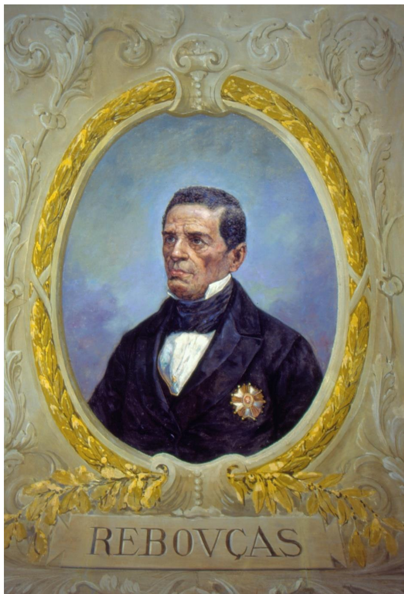
Conselheiro Antonio Pereira Rebouças.